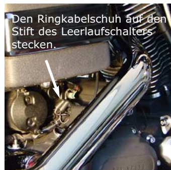
Den Ringkabelschuh auf den Stift des Leerlaufschalters stecken.