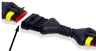
Schwarzes Ende mit dem Stecker des Kabelbaums verbinden

Die BikeWerk-TrickBox® CONTROL steuert automatisch den Stellmotor der Klappensteuerung, eine Fehlermeldung in der Bordelektronik wird zuverlässig vermieden.